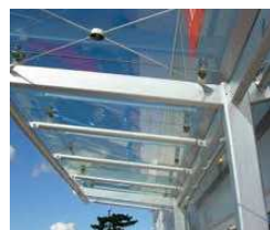
4. Scellement de débords à la façade ou de joints sur des débords.