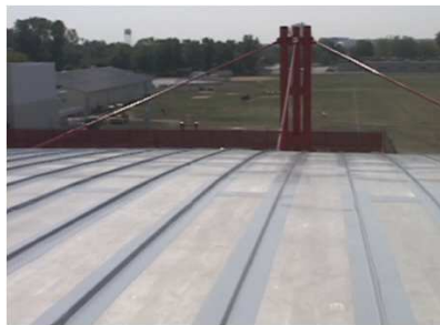
2. Scellement de connexions des revêtements de couverture.