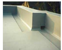
7. Scellement de joints de parapets.