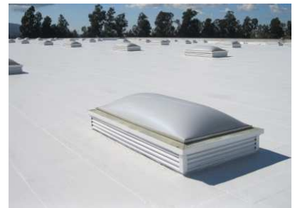
3. Scelllements de puits de lumière à la couverture.