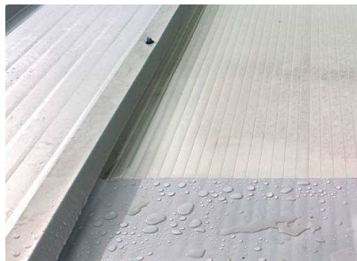
1. Scellement de connexions avec des polycarbonates.