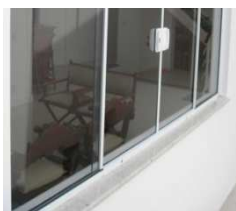
6. Scellement de joints de seuils.