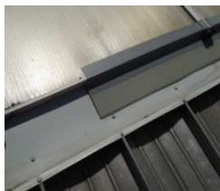
5. Scellement de joints de solins métalliques.